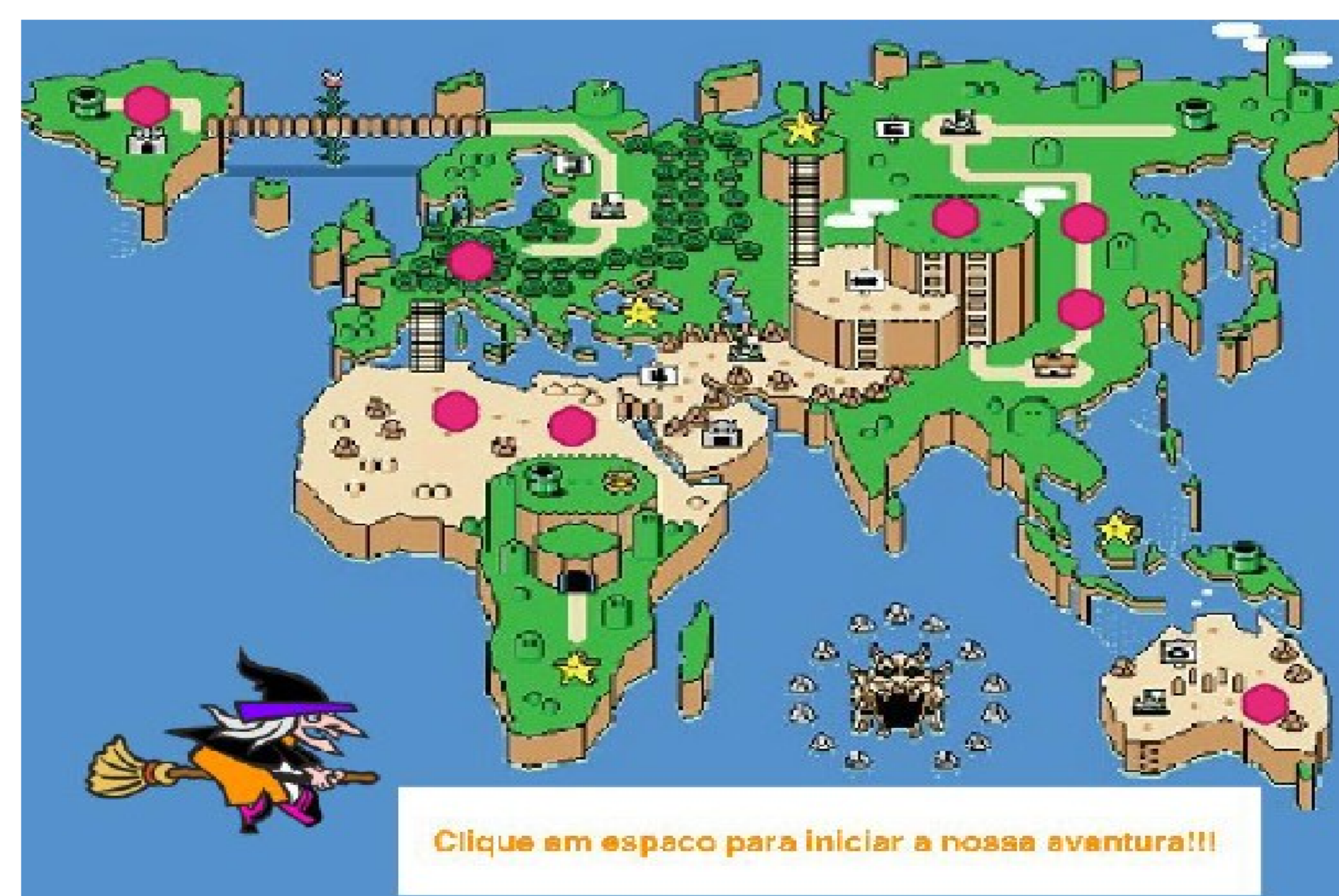
Fig. 2 – Painel cenário com o mapa do plano geral

O jogo inicia passando as instruções sobre o objetivo e como será conduzido o seu roteiro; imergindo o jogador no primeiro painel cenário que representa um mapa do plano geral (Fig. 2), exibindo o trajeto completo.