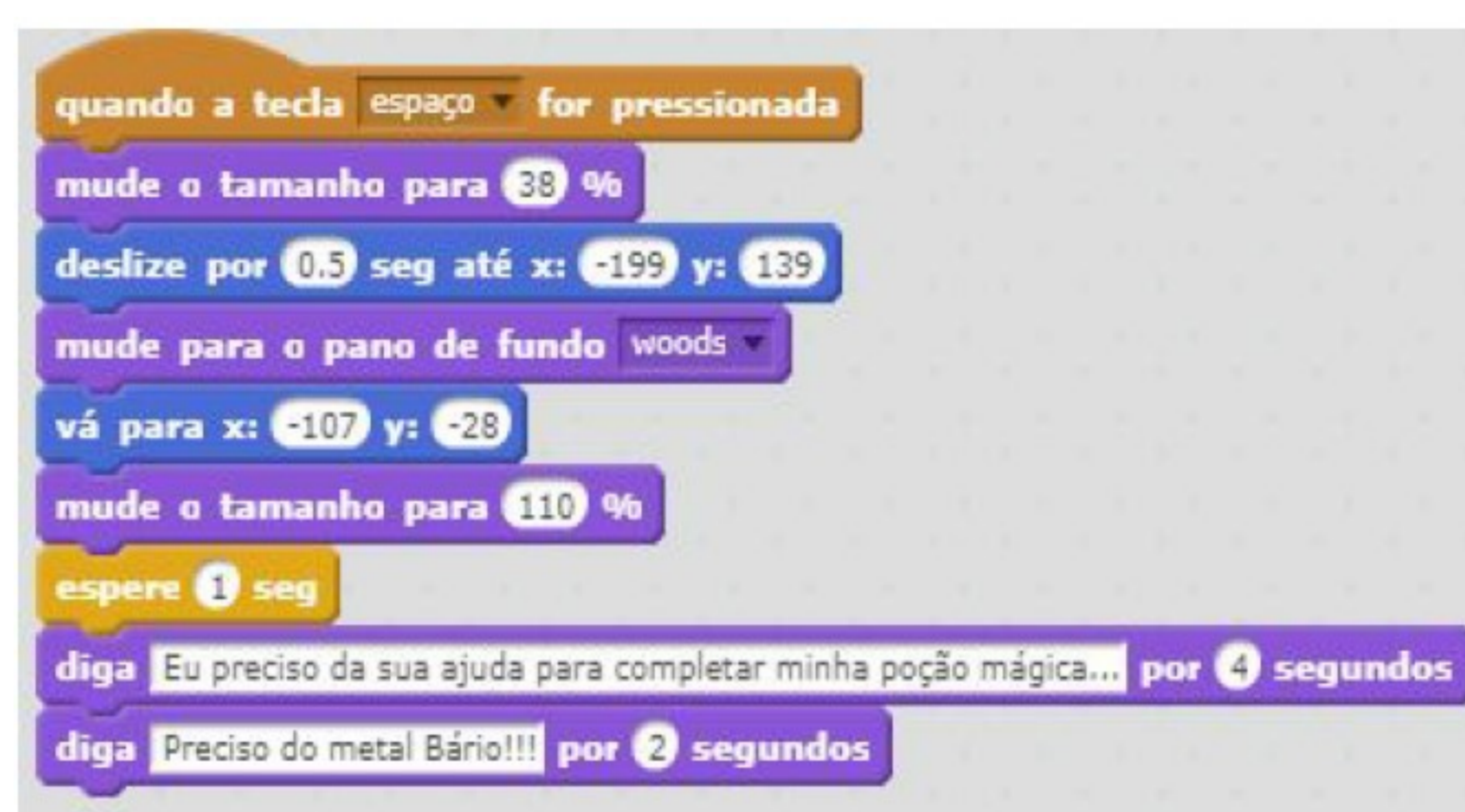
Fig 1 – Blocos de desenvolvimento do jogo em Scratch®

A Fig. 1 demonstra que o ambiente permite desenvolver o jogo encaixando-se blocos que de certa maneira também são considerados uma interface gráfica de usuário.