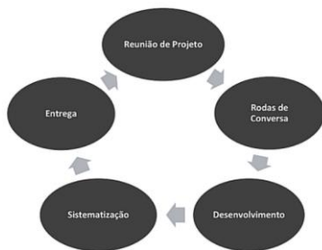
Figura 1 – Ciclo de geração do material cultural.

A entrega dos resultados às instituições parceiras do projeto de extensão contribui para que estas reproduzam as soluções internamente e orientem outras instituições congêneres na replicação das soluções demonstradas ao término do projeto. O processo de geração de material didático envolve os seguintes estágios: 1) Reuniões de projeto, 2) Rodas de conversa, 3) Desenvolvimento do material, 4) Sistematização e 5) Entrega. A Figura 1, abaixo, representa o ciclo de produção de material didático.